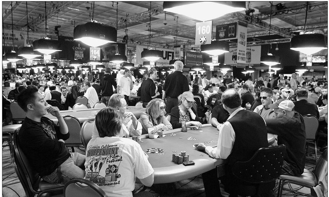
Spielfreude und Spielsucht spülte allein im Jahr 2006 8,2 Milliarden Dollar in die Casinokassen von Las Vegas

Liz verspielt ihren Lohn, ihr Ersparnis, leih sich dann Geld von Verwandten, das sie nie zurückzahlen wird. Manchmal habe sie schon realisiert,