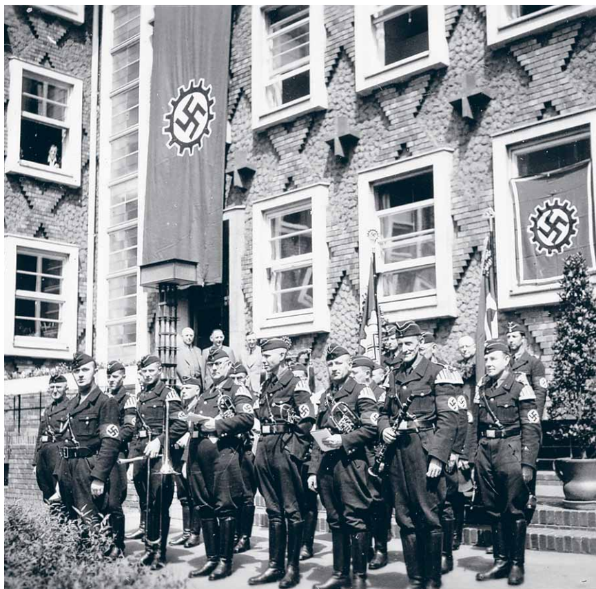
Nationalsozialistischer Musterbetrieb: MUSIKZUG vor einem Gebäude des Verein-Barmenia in Leipzig

Die private Krankenversicherung mag keine Fragen zu ihrer NS-Vergangenheit VON TOBIAS ROMBERG